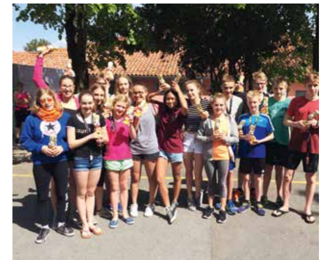
Osterhasen für alle in Koper.