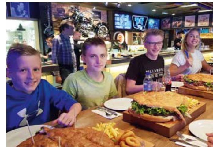
Grosse Burger für kleine Schwimmer. (Koper)