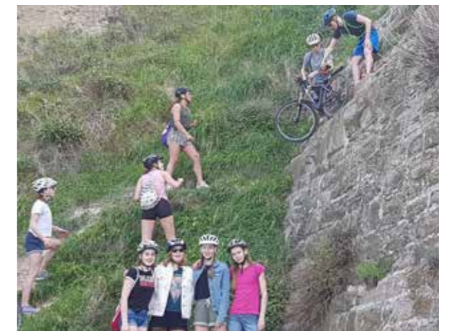
Fahrradtour in Koper.