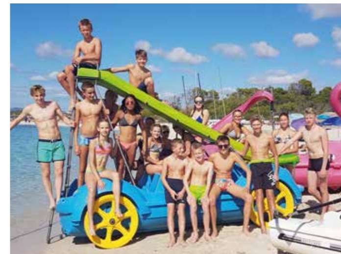
Niemals zu gross, um zu spielen. (Mallorca)