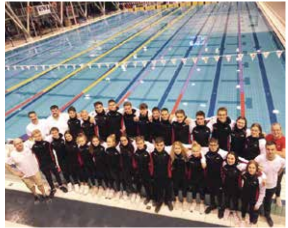
Juniorennationalmannschaft beim Wettkampf in Ungarn